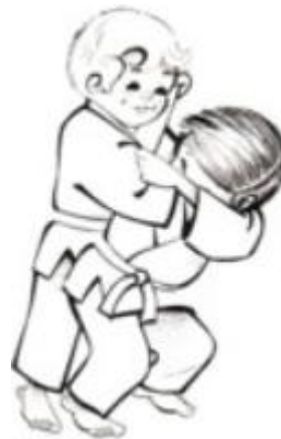
Tsuru komi goshi