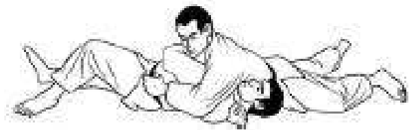
Kuzure kami shiho-gatame