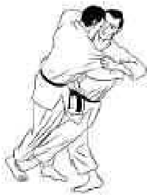
Harai tsumi komi ashi