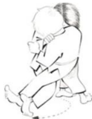
O uchi gari