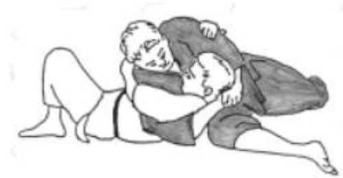
Makura gesa gatame