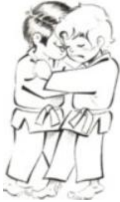
De ashi barai

Alle technieken van geel tot en met blauw kunnen uitvoeren in 3 verschillende richtingen. Yaku soku geiko.