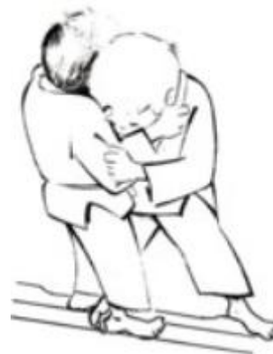
Ko uchi gari