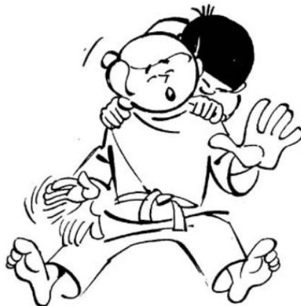
Sode guruma jime