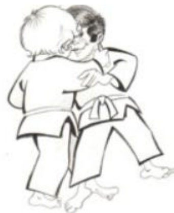
Ko soto gari