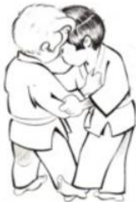
Ko soto gari