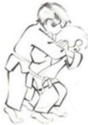
Morote sei nage