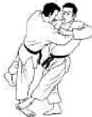
Sasae tsuri komi ashi