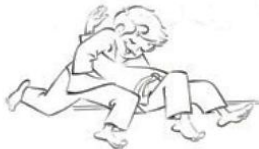
Ushiro gesa gatame