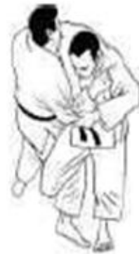
O soto gari