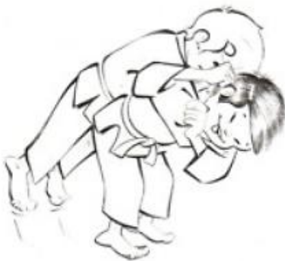
Ippon sei nage