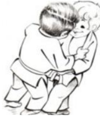
Okuri ashi barai